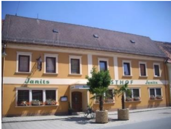
Gasthaus Ernst und Claudia Janits